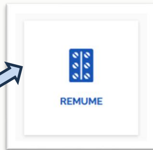
Botão da página

2 - Ao acessar o site principal, procure pelo ícone "REMUME" e clique nele.